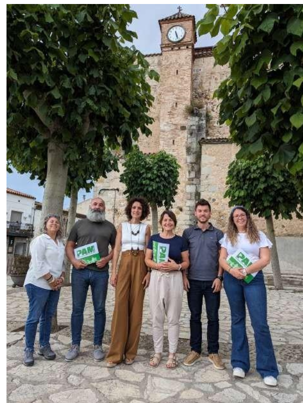
Equip de Govern de La Roca del Vallès

L'Ajuntament és l'administració pública més propera a la ciutadania i al territori, essent que amb aquest portal i la informació aquí oferta es vol fer un exercici de transparència i informació envers tots els ciutadans i ciutadanes del municipi, mostrant el compromís adquirit per part del consistori amb la lluita contra el canvi climàtic, la modernització del nostre entorn i en favor del benestar comunitari. El desplegament del PAM que aquí es presenta suposa un pas endavant en la millora de La Roca del Vallès, essent que en la mesura en que es vagi assolint el compliment dels projectes municipals aconseguirem avançar per a tenir un poble en el qual hi podem viure millor i el qual ens faci estar orgullosos del mateix.