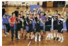
Cadet del BM la Roca, un equip de tripleta: Campions de Catalunya, Campions d'Espanya i guanyadors de la Copa Catalana.

No, crec que no. Jo treballa de monitor d'esport al centre penitenciari de Quatre Camins amb persones que estan privades de llibertat. Allà poden competir poc, ja que no poden entrar altres equips de manera regular... Així, l'esport serveix per evadir-se. També estic entrenant l'equip de veteranes del BM la Roca, noies d'uns 40 anys, que fins feia quatre anys només entrenaven sense competir, només fent algun partit amistós. Però el que sí és cert, és que si no fas algun partit, si no hi ha algun estímul de competitivitat, pot arribar a ser avorrit.