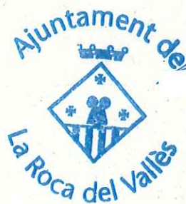
President CF La Roca Penya Blanc-Blava